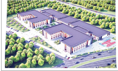
Organize Sanayi Bölgesi'nde planlanan Kayseri Üniversitesi OSB Teknik Kampüsü'nde yer alması planlanan OSB Meslek Yüksekokulu ile Mühendislik ve Tasarım Fakültesi binalarının projede değerlendirme toplantısı yapıldı.