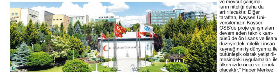
ki 5 fakülte ve 12 meslek yüksekokulu ile işgücü piyasalarının ihtiyaçları çerçevesinde belirlenen amaç ve hedeflere ulaştırabilecek faaliyetlerini sürdürmekte; nitelikli insan kaynağına ihtiyaç duyulan tüm sektörlerin bu ihtiyaçlarını eksiksiz bir şekilde karşılamaya yönelik donanımına sahip mezunlarının Türk çalışma hayatına dahil olabilmesi için gayret içerisinde olduklarını ifade etmiş ve Türkiye İş Kurumu'nun İşgücü Piyasası Araştırması Türkiye Raporu ve Kayseri İli 2023 Sonuç Raporu ile ilgili şu değerlendirmelerde bulunmuştur: "Kayseri Üniversitesi, Türkiye işgücü piyasalarının ihtiyaç duyduğu sektörlerdeki meslek alanlarında başta nitelikli ara insan kaynağı olmak üzere nitelikli mezunları vermek üzere hareket etmekte ve buna uygun yeni atılımlar ve girişimlerde bulunmaktadır. Son bir yıl içerisinde Organize Sanayi Bölgesi'nde faaliyete başlayan Organize Sanayi Bölgesi Meslek Yüksekokulu'na ait kaynak teknolojisi, polimer teknolojisi, endüstri ürünleri tasarımı programları en yüksek oranda açık iş pozisyonu olan imalat sektörüne aranan nitelikli insan kaynağının yetiştirilmesini sağlayacak şekilde donanımlandırlarak faaliyetlerini sürdürmektedir. Diğer taraftan Yükseköğretim Kurulu'nun önemle üzerinde durduğu yapay zekâ, dijitalleşme ve büyük veri alanlarında oluşturulması planlanan birimlerin hayata geçirilmesi ile de bu çalışmalara ivme kazandıracak ve mevcut çalışmaların niteliği daha da artıracaktır. Diğer taraftan, Kayseri Üniversitemizin Kayseri OSB'de proje çalışmaları devam eden teknik kampüsü de ön lisans ve lisans düzeyindeki nitelikli insan kaynağının iş dünyamız ile bütünlük olarak yetiştirilmesindeki uygulamaları ile ülkemizde öncü ve örnek olacaktır."